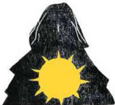
Freyr: zeul belșugului și al Soarelui, fratele Freyjei.