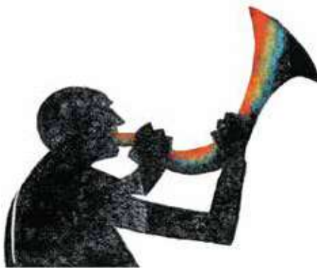
Heimdall: străjerul zeilor.