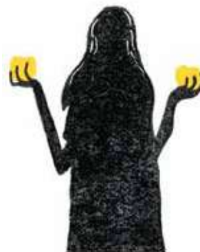
Idun: cea care se îngrijește de merele de aur ale tinereții.