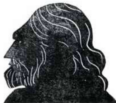
Njord: zeul marinarilor și al pescarilor.