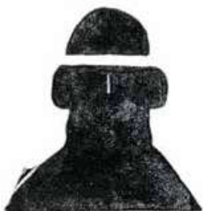
Hod: fratele orb al lui Balder.