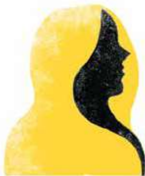
Sif: soția cu bucle aurii a lui Thor.