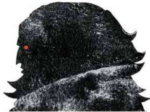
Thor: zeul tunetului, fiul lui Odin; luptă cu ajutorul ciocanului lui, Mjollnir.