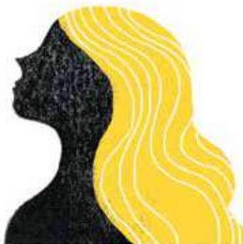
Freyja: cea mai frumoasă dintre zeițe, sora lui Freyr.