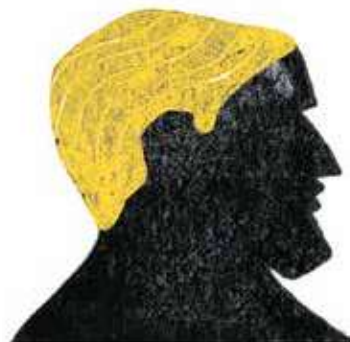
Balder: cel mai bun și mai blând dintre zei, fiul lui Odin și al lui Frigg.