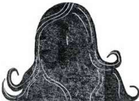
Frigg: cea mai însemnată dintre zeițe, soția lui Odin și mama lui Balder.