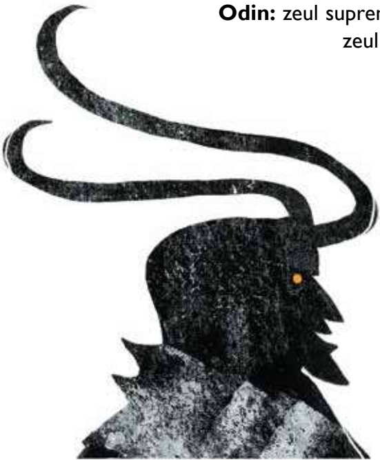
Loki: fiul a doi giganți, un escroc care face numai rele.